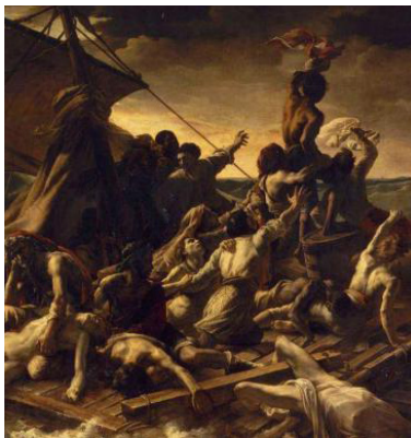
T. Géricault, Le Radeau de la Méduse , détail, 1818-19, Musée du Louvre

Hector Berlioz (1803-1869) a lancé le mouvement de la musique romantique en France, notamment avec sa Symphonie fantastique en 1830, avec pour titre original Episodes de la vie d'un artiste .