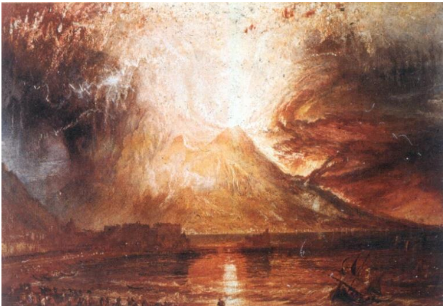
W. Turner, l'Eruption du Vésuve , 1817, aquarelle, Centre Britannique de Yale