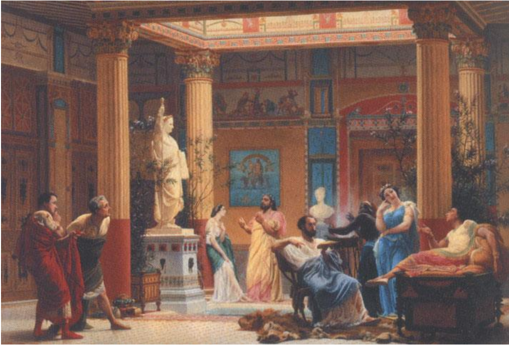
Gustave Boulanger, La répétition du Joueur de flûte dans la Maison pompéienne du prince Napoléon , 1860

Ce concert théâtralisé, pour solistes, chœur et piano, fait correspondre des textes en français et des extraits musicaux allant du XVIII e au XX e siècle (Philidor, Mozart, Hahn, Félicien David, Pacini, Joncières, Offenbach, Saint-Saëns, Lefébure-Wély). Il nous invite au voyage et nous plonge dans une histoire romanesque sur les traces des Derniers jours de Pompéi.