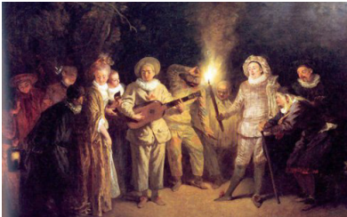
Antoine Watteau, L'Amour au théâtre italien , 1721

Cette capacité à se jouer des relations amoureuses, à grand renfort de déguisements, quiproquos et autres situations cocasses est omniprésente dans les opéras de Mozart.